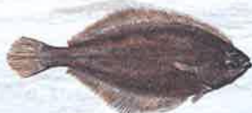
Hippoglossoides platessoides · Håising Long rough dab · Oqutaq