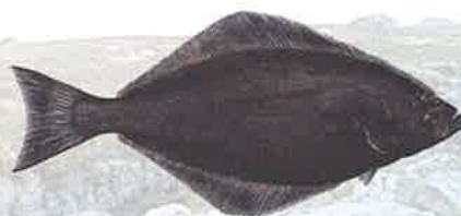
Hippoglossus hippoglossus · Helleflynder Atlantic halibut · Nataarnaq