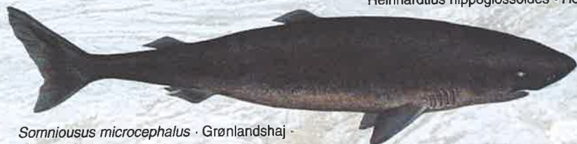
Somniousus microcephalus · Grønlandshaj · Greenland shark · Eqalussuaq

Den arktiske natur er sårbar - fang kun hvad du kan spise! Spørg på turistkontoret efter de lokale fredningsbestemmelser m.v.