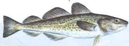
Gadus morhua · Torsk · Cod · Saarullik