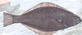
Reinhardtius hippoglossoides · Hellefisk · Qaleralik